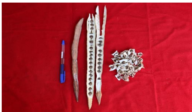
Fig. 1 Fruto y semilla de Moringa oleífera Lam.

El material utilizado en este trabajo procedió del biohuerto Agroline 360, Sechura-Piura a una latitud 5°27'10.62"S, longitud 80°46'9.77"O y 13 m sobre el nivel del mar, de donde se colectaron aleatoriamente frutos y semillas de 15 árboles. Después de la colecta, los frutos fueron transportados al Laboratorio de Biotecnología del Instituto de la papa y cultivos andinos de la Universidad Nacional de Trujillo, en donde fue seleccionada al azar una muestra de 225 semillas. Las semillas se distribuyeron en tres tratamientos de 75 semillas cada uno, las cuales se sumergieron en soluciones de ácido giberélico con concentraciones de 0,00 ppm, 35,00 ppm, 70,00 ppm por 24 horas, correspondiendo al tratamiento 1, tratamiento 2 y tratamiento 3 respectivamente. Luego el número de semillas por tratamiento se distribuyeron en 3 placas Petri con 25 semillas cada uno. La toma de datos se realizó a partir de los 5 días después de la instalación del experimento y hasta que ya no se observó semillas en germinación, los datos se consignaron en tablas para ser analizados. Para el análisis estadístico se usó ANAVA y comparación de medias con Tukey a 0.05 de nivel de significancia.