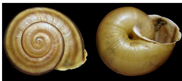
Fig. 3. Caracol terrestre del género Epiphragmophora