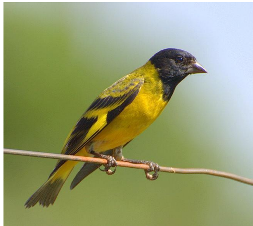
Fig. 5 Jilguero de cabeza negra, Spinus magellanicus paulus