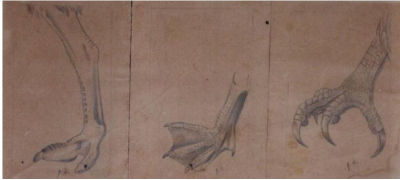
Fig. 4a. Dibujo a lápiz de tipos de patas de aves realizados por don Juan Ormea R.