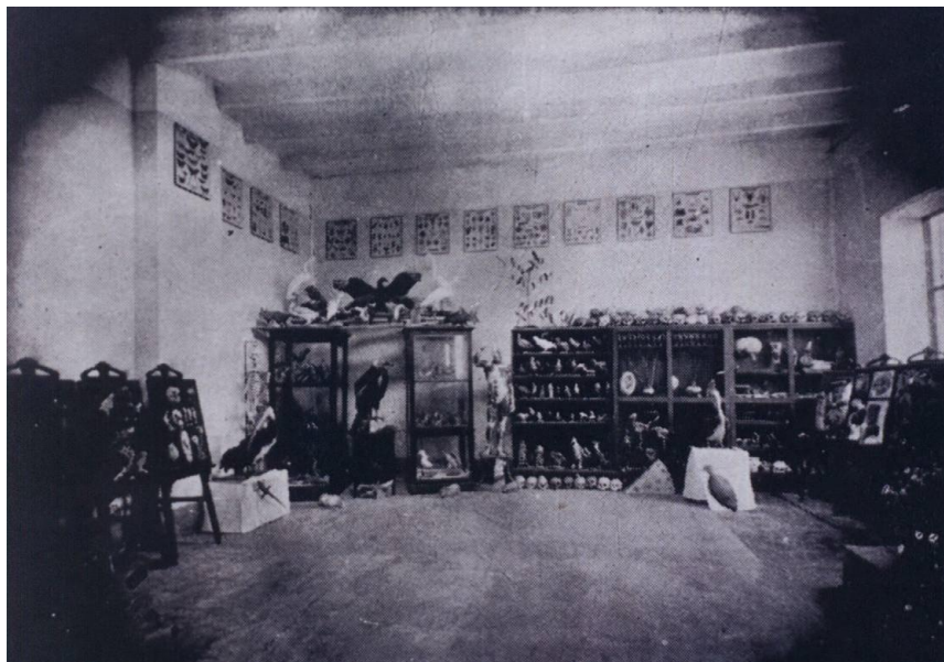
Fig. 6a Sala de exposición en los inicios del museo, tomada a mediados del año 1938. (Tomado del anuario editado por la Universidad Nacional de la Libertad - 1938)

Promovió continuas excursiones para realizar colectas y capturas; manejando y aplicando experiencia y conocimiento de las técnicas taxidémicas, que han permitido que la colección del museo posea especímenes importantes preparados por él, que perduran en el tiempo, como son entre otros la "diuca ala blanca" Diuca speculifera , Opucerthia validirostris , "pijui cola de tijera" Synnalaxis striata , "zorro de Costa" Lycalopex sechurae , "garcita leonada" Tigrisoma Sp. , algunos ejemplares en la colección han cumplido más de 70 años y todavía se mantienen en pie, gracias a la calidad del trabajo profesional realizado.