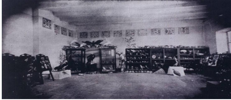
Fig. 2 Ambiente inicial del Museo de Zoología Regional hoy Museo de Zoología Juan Ormea Rodríguez

La parte expuesta de la colección de vertebrados incluye piezas de la colección inicial, formada y preparada por el taxidermista Juan Ormea Rodríguez conocida como colección Ormea. La colección del museo se vio incrementada con donaciones, capturas y colectas, estas últimas realizadas durante las salidas programadas al campo, actividades que tuvieron en su momento el apoyo de las autoridades universitarias; así como de la participación de los docentes y estudiantes en un período de auge y apogeo en la década del 50 y 60.