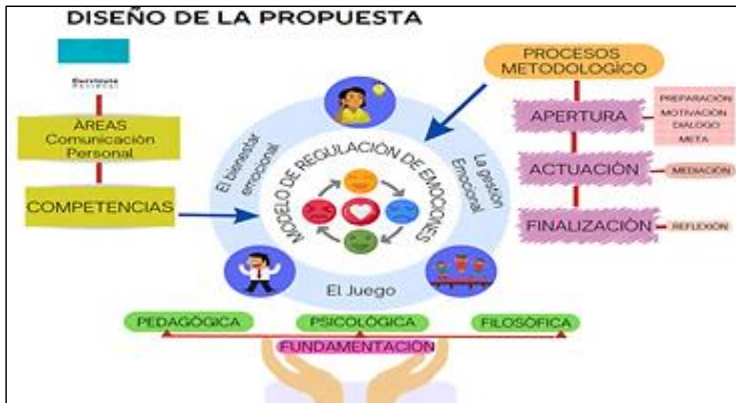
Figura 2: Propuesta de Modelo de Regulación de Emociones.

-La duración de las actividades fue de 45 minutos cada uno y la secuencia metodológica que se utilizó fue: 1) Se desarrollaron 18 Actividades Lúdicas, con una metodología activa y participativa siendo los estudiantes el centro del aprendizaje, 2) Las actividades lúdicas y el modelo considerado, se desarrollaron en las instituciones Iniciales del grupo experimental de la RED "El Gran Curaca de Chuspo" Reque – Chiclayo.