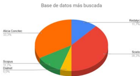
Figura 1. Base de datos más buscada Estrategia de Búsqueda. Las estrategias de búsqueda se diseñaron para incluir términos relacionados con "Gestión administrativa" y "Satisfacción laboral".

Fuentes de Información. Se realizaron búsquedas en las bases de datos académicas Scopus, Redalyc, Dialnet y SciELO hasta la fecha más reciente disponible, asegurando una cobertura exhaustiva de la literatura relevante. Seguidamente, en la "figura 1", se puede observar las consideraciones que se tuvo para realizar el presente artículo. Luego, en el Diagrama de flujo se puede observar el proceso Prisma. Figura 1. Flujo Prisma.