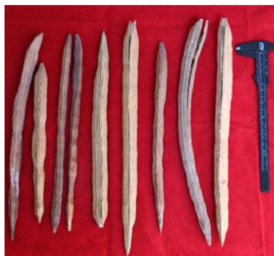
Figura 1. Medida de longitud y ancho de fruto de Moringa oleifera Lam.

El material utilizado en este trabajo procede del Biohuerto Agroline 360, ubicado en la latitud 5°27'10.62"S y longitud 80°46'9.77"O, donde se colectaron frutos maduros de 15 árboles. Después de la colección, los frutos fueron transportados al Laboratorio de Biotecnología del Instituto de la papa y cultivos Andinos de la Universidad Nacional de Trujillo, en donde fue seleccionada una muestra de 30 frutos. Luego se procedió a realizar la medición de la longitud y ancho de los frutos (Figura 1), contabilizar el número de semillas por fruto (Figura 2) y peso de estos sin semillas (Figura 3). De igual manera para el análisis biométrico de las semillas se seleccionaron 30, donde se determinaron la longitud y el ancho de las semillas. Posteriormente se pesó la masa individual y grupal de 50 semillas con 6 repeticiones.