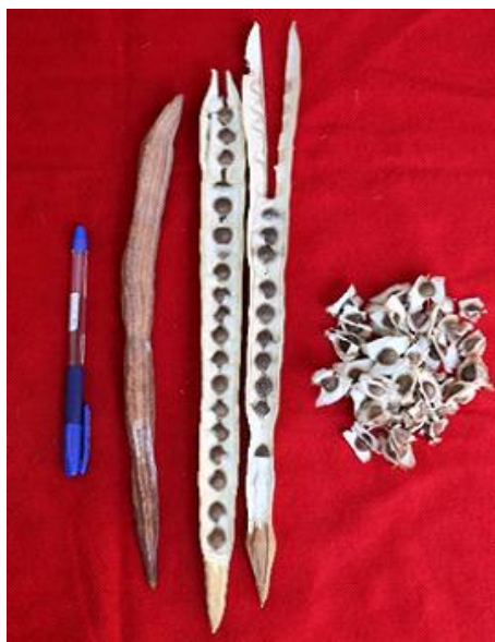
Figura 2. Número de semillas por fruto de Moringa oleifera Lam.

mientras la medición de la longitud del fruto se realizó con una cinta métrica, para el pesado de frutos y semillas se empleó una balanza analítica. Finalmente, los datos biométricos se analizaron con el cálculo de la media y desviación estándar.