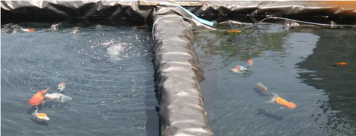
Fig.2. Pozas artificiales outdoor de descanso reproductivo para reproductores hembras(izquierda) y machos (derecha) de C. auratus .

En cuanto a los muestreos biométricos realizadas a las crías de goldfish se obtuvieron tallas de 12 a 20 mm a los 17 días de edad, con pesos de 0,07 a 0,10 g con larvas de color gris y a los 57 días alcanzaron entre 22 a 36 mm con pesos de 0,44 a 1,14g con color naranja a los cuales se les consideró como semilla (Tabla 3).