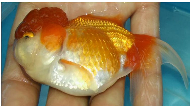
Fig.1. Reproductora de goldfish de 243 g de la variedad Yamagata con amplio abdomen de capucha roja cuerpo dorado de colores rojo naranja, blanco y amarillo.

Se obtuvieron tres eventos reproductivos de agosto a octubre 2015 (Tabla 2), el primer desove ocurrió el 31 de agosto 2015 y luego ocurrieron en forma mensual hasta octubre, en noviembre y diciembre estos no lograron tener la madurez suficiente para desovar. La puesta tuvo un rango entre 4200 y 5800 con un promedio de 5000 huevos.