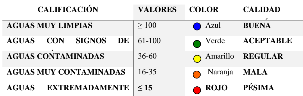
Tabla 3: Valores del índice biótico para ríos del norte del Perú nPeBMWP según los rangos de calidad 15-16 .