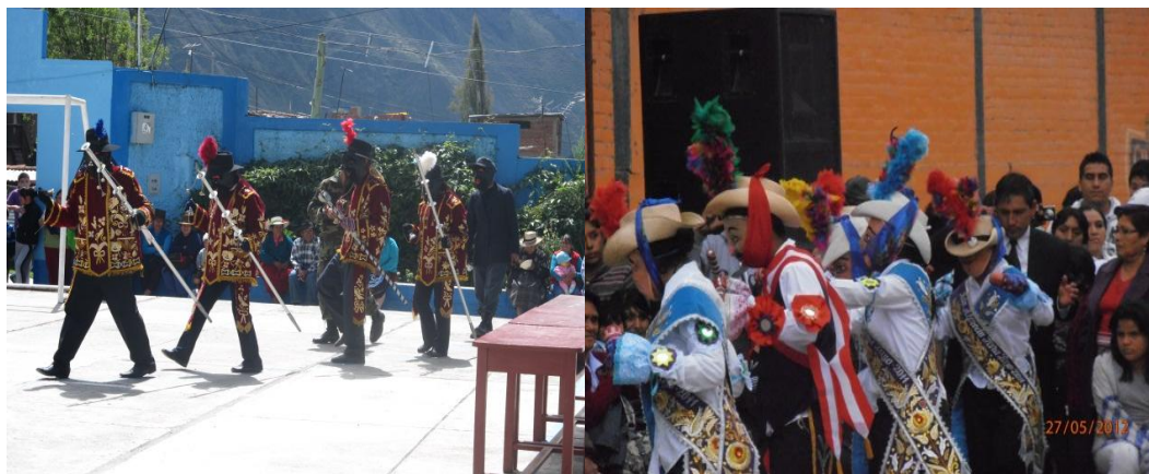
Fig. 3. Los negritos o caporales