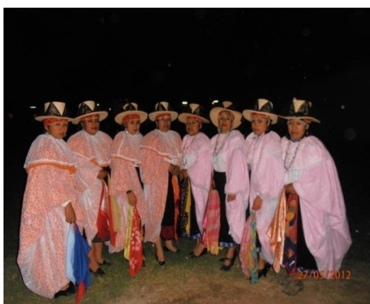
Fig. 1. Las pallas

Se utilizó además la técnica de la estadística descriptiva, con la presentación de tablas de distribución de frecuencias, figuras, indicadores estadísticos como media aritmética, varianza y coeficiente de varianza.