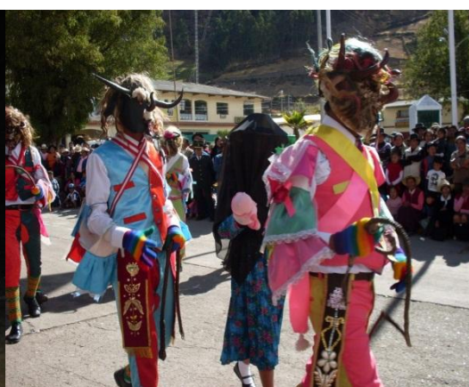
Fig. 2. Los diablitos