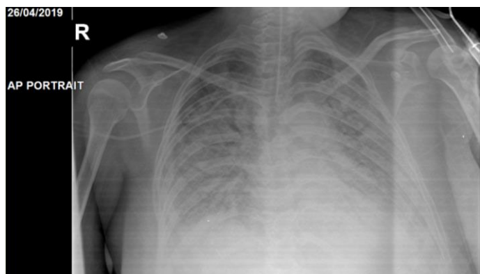
Figura 3: Última radiografía de tórax control (día 21 de hospitalización).

Neumología e Infectología aprobaron inicio simultáneo de esquemas para manejo de tuberculosis sensible y TARV respectivamente. La paciente falleció al 25° día de tratamiento a pesar del manejo multidisciplinario persistiendo con mala evolución radiológica (figura 3).