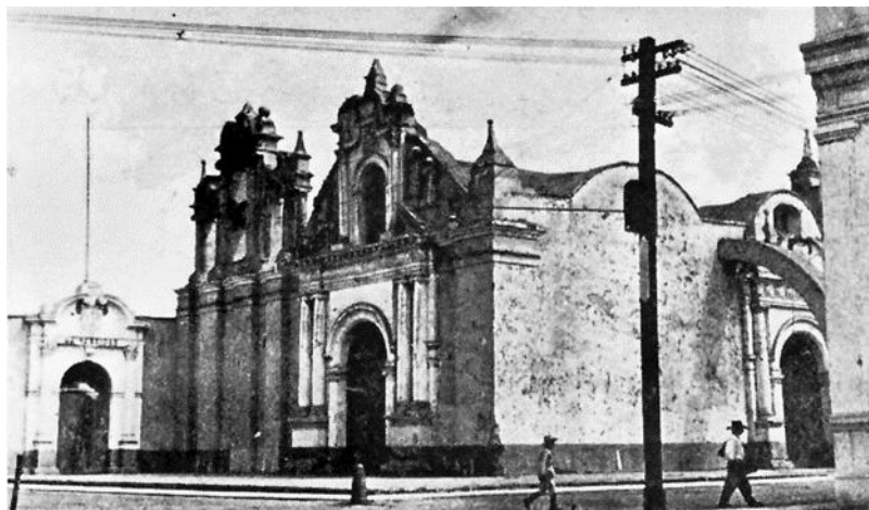
Fig. 7. Iglesia y convento Jesuita, sede de la universidad Nacional de La Libertad (Hoy Universidad Nacional de Trujillo ( https://bioanatomia.edu.pe/index.php/historia-de-la-universidad-nacional-de-trujillo/ )).