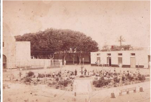
Fig. 3. Retrato de Isabel Rodríguez Farfán, madre de Juan Esteban Ormea Rodríguez (Geni, 2023). Fig. 4. Plaza de armas San Pedro de Lloc 1882 ( https://sientetrujillo.com/san-pedro-de-lloc-un-paraiso-por-descubrir-galeria-de-fotos/ ).