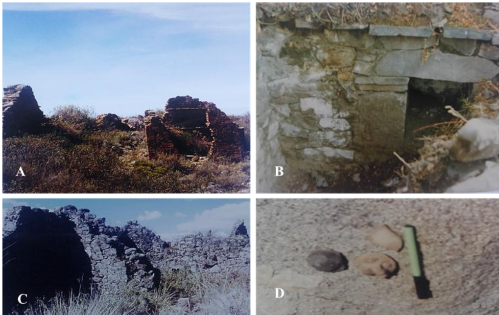
Fig 4. Arquitectura pública y funeraria en el complejo monumental Acque. A. Estructura funeraria de planta cuadrangular semidestruida por huaqueros; B. Tumba saqueada al interior de recinto en Acque Chico, nótese nicho con dintel, estaba cubierta con grandes lajas de piedra; C. Restos de estructura de habitación en Acque grande; D. Fragmentos de pequeña escultura trabajada en cerámica de clara factura Virú, hallada en pozos de huaquero.

fragmentación lítica estructural, el saqueo y disturbamiento de sus unidades funerarias, como también por la expansión agrícola moderna (Fig.4).