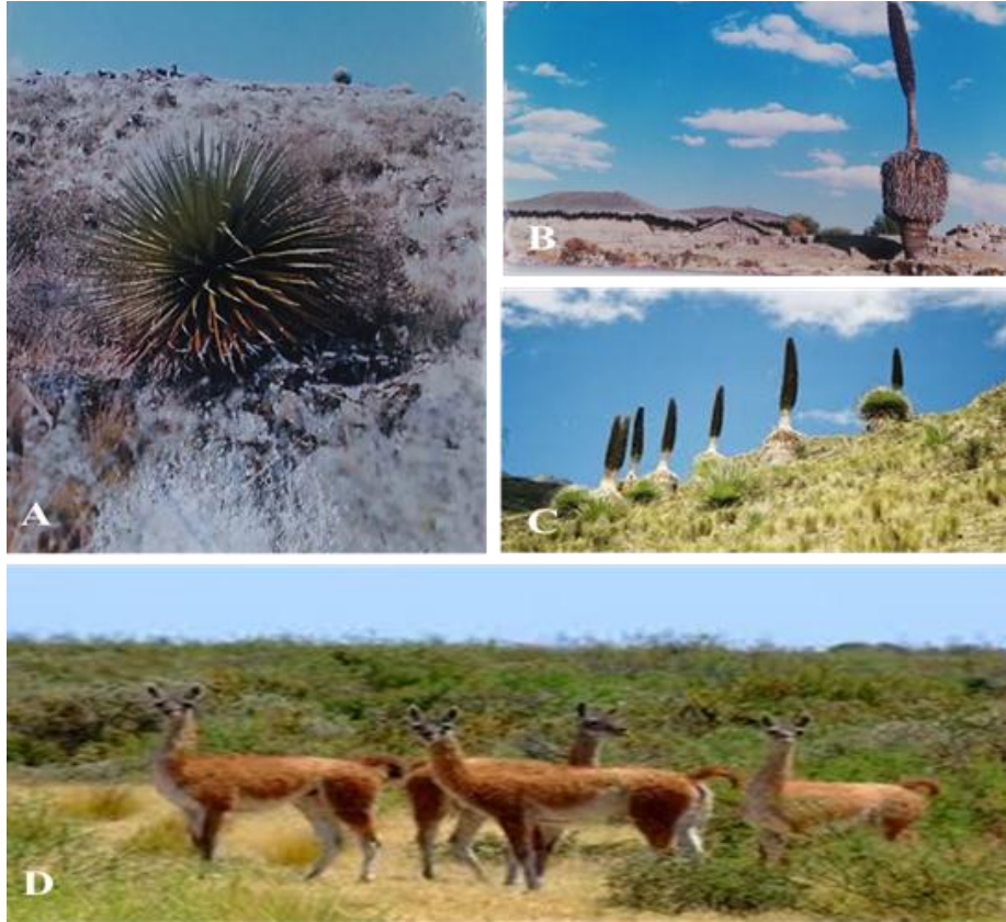
Fig. 3. Principales especies de las ANP-Calipuy. A. Especimen juvenil de Puya raimondii conocida localmente como “Cahua” nombre de origen Culle; B. Caserío “La Colpa” y ejemplar de Cahua adulta; C. Formación de Cahuas al NE del SNC; D. Pequeña manada de Lama guanicoe Cacsilensis “Guanacos”.

Toda el área turística 3 Uningambal - Calipuy ante la falta de planificación y estructuras básicas protectivas in situ, en su conjunto hoy es causa de una intensa destrucción, por mano de saqueadores, ganado vacuno e irresponsables visitantes, en especial el SNC, que a la fecha ha sufrido procesos irreversibles de fragmentación extrema en los rodales de Cahua, producto de agresiones directas antrópicas (Fig.3). Por lo tanto esta especie en peligro tiene un futuro incierto (Lambe, 2008; Hornung et.al., 2013; Zuschlag, 2013).