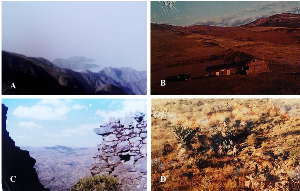
Fig. 1. A. Vista panorámica de los cerros costeros en Chao A. Desde el sitio Peñón del encierro; B. Caserío "La Colpa" al atardecer en Acque; C. Sección de muro caído estilo Chugo-Culle; D. Descenso al valle seco de Matala-RNC.

El monumento está rodeado por un sistema biótico perteneciente a la formación pradera húmeda montano, de clima frio a húmedo y ricos suelos productores de tubérculos, las plantas arborescentes son escasas, salvo pequeñas manchas residuales de Polylepis incana "Queñoas" y "Quishuar" Budleja sp. "Quishuar", ubicadas en las depresiones de las quebradas, mayormente dominan las gramíneas de puna como es el caso de algunas especies de Bacharis sp. Las cuales constituyen la flora acompañante de la Puya raimondii "Cahua". Además de aves, fauna mediana y pequeña propia de estos ecosistemas (Martin, 1997; Zelada, 1997). Una comunidad importante de Satureja rugosa "Panizara" ha sido identificada también al interior de las unidades arquitectónicas del Complejo urbano Monumental de Acque (Cárdenas & Gutiérrez, 1999).