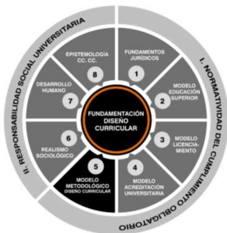
Figura 3. Fundamentos de la Propuesta de Diseño Curricular para mejorar el Perfil de Egresado. Elaboración propia.

La propuesta de diseño curricular para mejorar el perfil de egreso del Programa de Estudios de Ciencias de la Comunicación de la Universidad Nacional de Trujillo se fundamenta en dos dimensiones: Normatividad de cumplimiento obligatorio y la responsabilidad social universitaria (Figura 3).