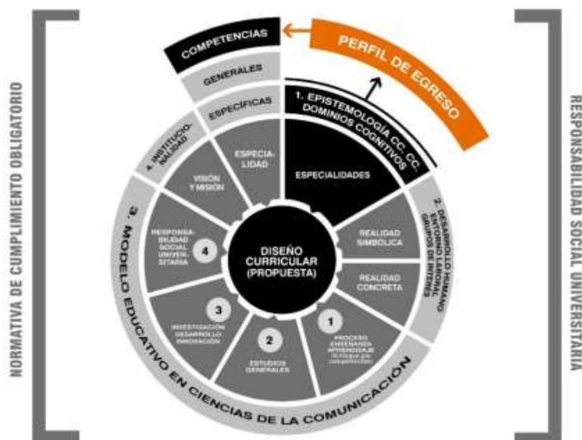
Figura 4. Componentes de a propuesta de rediseño curricular para mejorar el perfil de egreso del Programa de Estudios de Ciencias de la Comunicación.

educativo en Ciencias de la Comunicación Social (proceso enseñanza-aprendizaje; estudios generales; investigación; desarrollo e innovación; y responsabilidad social); d) Componente 4: Institucionalidad universitaria UNT (misión; visión, principios y valores; y, e) Componente 5: Competencias (generales, específicas y especialidad).