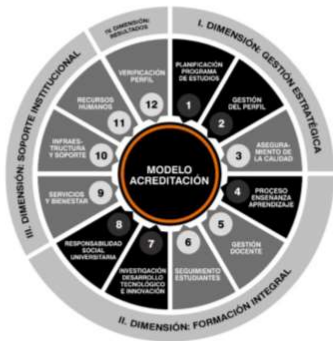
Figura 1. Matriz de acreditación para Programas de Estudios de Educación Superior Universitaria.

En la lógica del modelo de acreditación, los elementos ejes del proceso de formación integral que determinan el perfil de egreso son: a) Responsabilidad Social Universitaria; b) Proceso Enseñanza-Aprendizaje; y, la Investigación, Desarrollo Tecnológico e Innovación (I+D+i). Se tiene como actores claves a los docentes y estudiantes. Asimismo, se destaca la participación e interacción con los grupos de interés, tanto en la dimensión de Gestión Estratégica como en la de Resultados porque se convierten en una fuente de información privilegiada que el programa de estudios requiere, tanto para alimentar el diseño y pertinencia del perfil de egreso, identificar procesos que se requieren para desarrollarlo, así como en relación al grado de satisfacción con la formación de los egresados, ayudando de esta manera a la evaluación del desempeño. Es decir, la verificación de resultados de aprendizaje o perfil de egreso y objetivos educacionales (Figura 2).