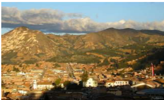
Figura 1. Vista de la ciudad de Huamachuco

El distrito de Huamachuco (Fig. 1), de acuerdo a la tipificación de las regiones naturales del país por Pulgar Vidal corresponde a la denominada Región Quechua, con clima templado a frío y con escasa humedad y lluvias en el verano (enero- marzo), cuenta con 55 Centros poblados, de los cuales 3 son urbanos (Huamachuco, Shiracmaca y Yanasara) y los otros 52 son rurales.