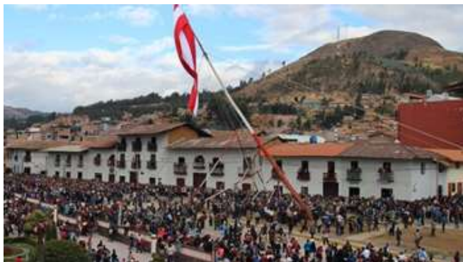
Figura 3. Parada de gallardete