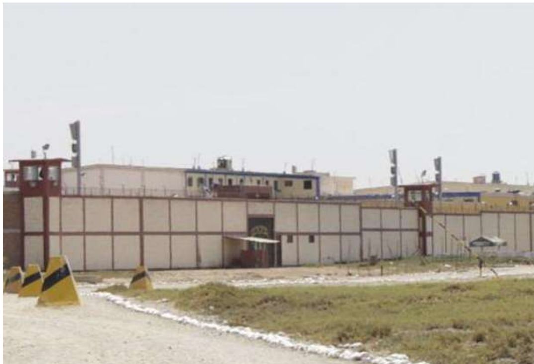
Figura 2: Exterior del Establecimiento Penitenciario de Picsi. Foto tomada el año 2015.