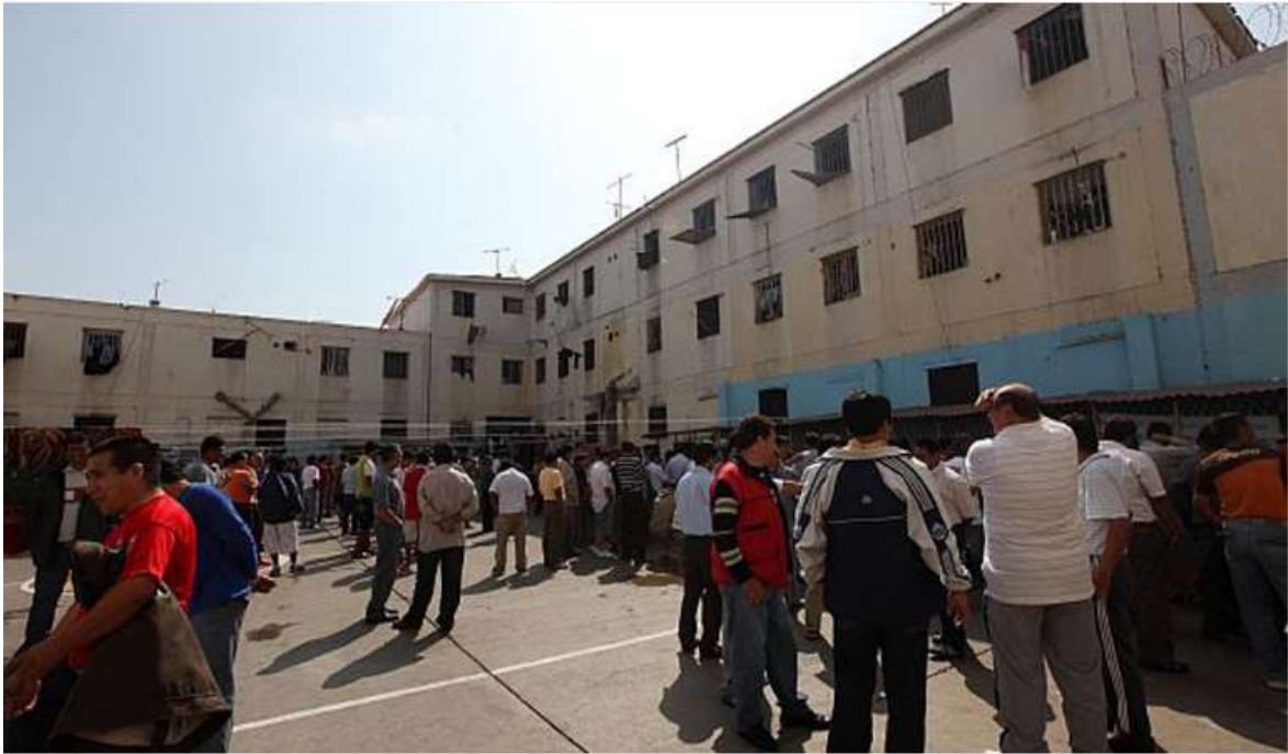
Figura 3: Interior del Establecimiento Penitenciario de Pisci. Foto tomada el año 2016.