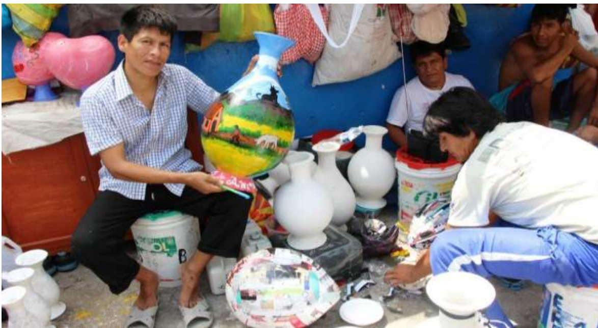
Figura 4: Trabajo al interior del Establecimiento Penal de Pisci. Foto tomada el año 2015.

De toda la población universo de internos recluidos en el Establecimiento penal de Pisci ascendentes a 3600 personas, se ha trabajado con una población de 118 internos que cumplan la totalidad de los siguientes requisitos: (1) Edad ente 18 a 30 años, (2) Reos comunes sentenciados por delitos menores, (3) Condenas de hasta 8 años, (4) No tener adicciones (alcohol o drogas), (5) Primera condena y, (6) Apoyo del entorno. De estos 118, la muestra trabajada es de 91 internos que satisface la necesidad de este estudio.