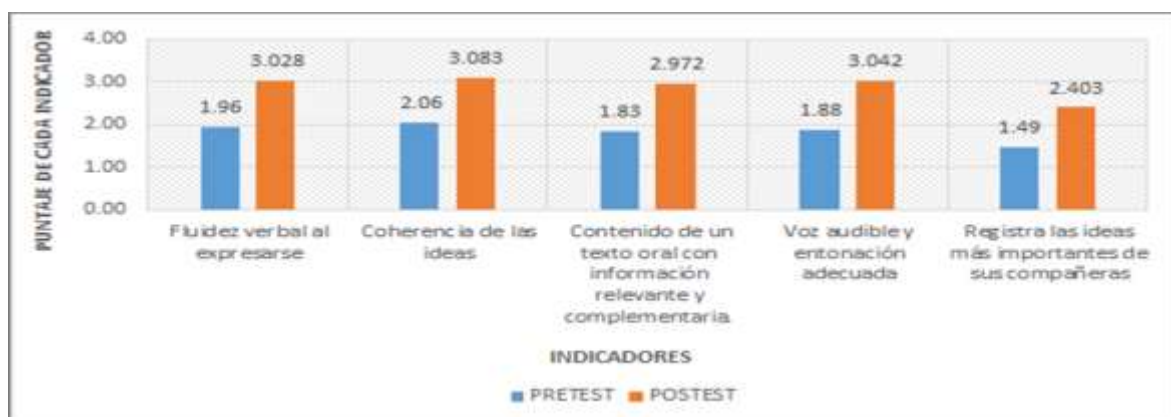
Figura 1. Comparación de los porcentajes en comprensión y expresión oral del grupo experimental, a nivel de pre test y post test, área de ciencias sociales. Segundo grado, I.E. María Negrón Ugarte, Trujillo.

En la Tabla N° 10 , se observó que los resultados, en debate, a nivel post tes, t en el indicador orden de ideas a partir de sus saberes previos y fuentes de información fueron 69 estudiantes (96%); en el indicador expresa el contenido de un texto oral integrando información relevante y complementaria, en el indicador participa en interacciones haciendo preguntas en forma oportuna, 46 estudiantes (64%), en el indicador emplea un tono de voz adecuado, 67 estudiantes (93%), y en el indicador escucha con atención la participación de sus compañeras antes de responder 40 estudiantes (55%) tuvieron un rendimiento adecuado.