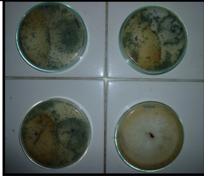
Fig. 2: Efecto antagónico de Trichoderma harzianum sobre Rizoctonia solani , extraído de tubérculos de papa ( solanum tuberosum ): Grado Antagónico 1: Trichoderma harzainum . Crece completamente sobre la colonia del patógeno y cubre la superficie del medio de cultivo.

En la gráfica N° 2 Se observa que a los siete días de incubación el grado de antagonismo según la escala de Bell y col, corresponde al de tipo 1 donde, Trichoderma harzainum Crece completamente sobre la colonia del patógeno y cubre la superficie del medio de cultivo.